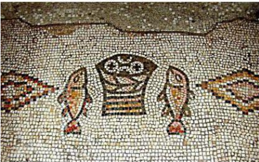
Mozaïekvloer van de Byzantijnse kerk uit de 5e eeuw in Tabgha, Israël. Klik hier voor enige achtergrondinformatie.