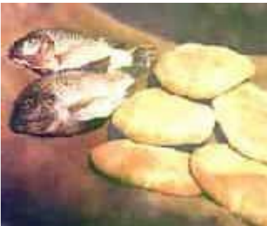
Vijf broden en twee vissen: meer afbeeldingen .